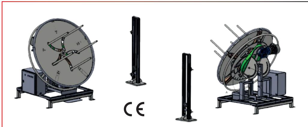
OPTION CONTRE JOUE

Particulièrement adapté pour l'enroulage des tuyaux flexibles hydrauliques